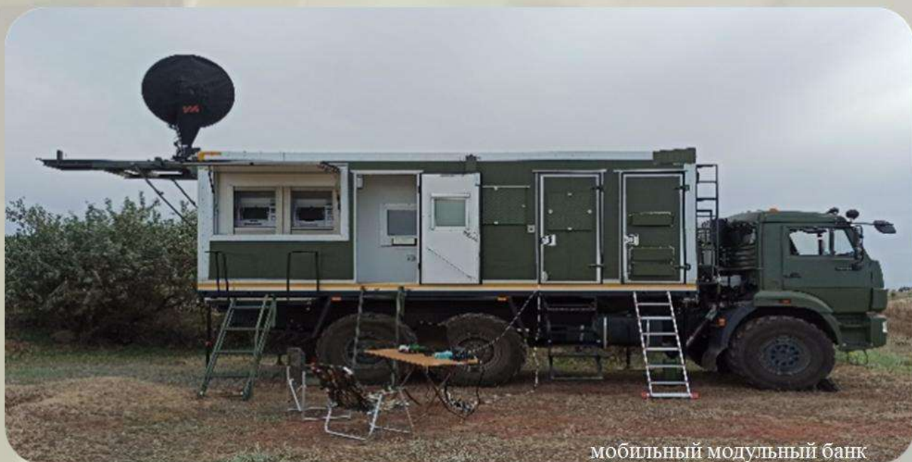
МОБИЛЬНЫЙ МОДУЛЬНЫЙ БАНК